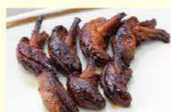
「肝焼き」入り 数量限定 〈プラス)税込1,430円