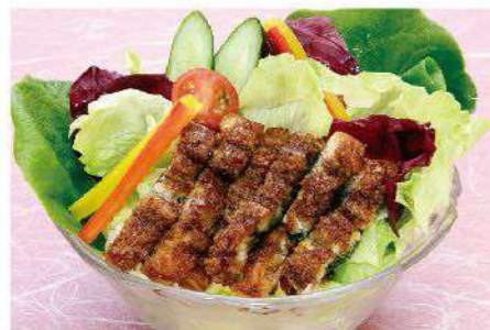
う家サラダ 1,900円(税込2,090円)