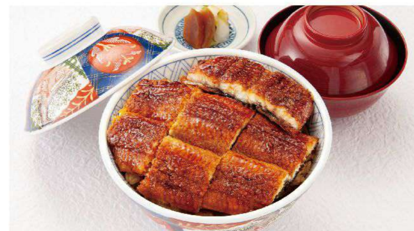
う家井 (うなぎ2/3匹 ご飯300g)