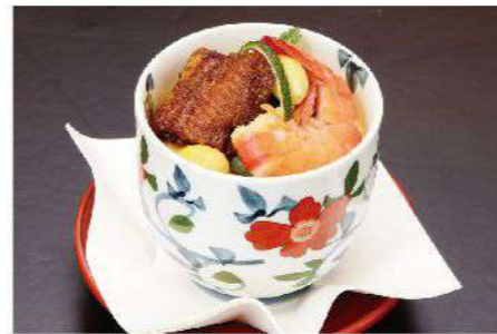
うなぎ茶碗蒸し 750円(税込825円)