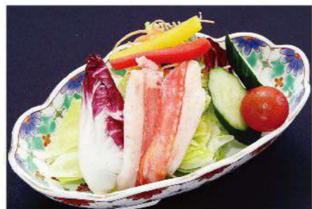
かに入りサラダ 1,200円(税込1,320円)