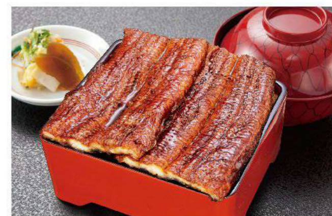
う家重 (うなぎ1匹 ご飯350g)