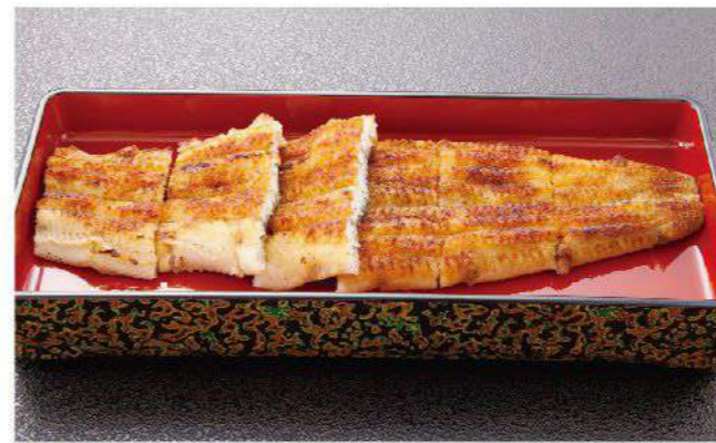
白焼き(1匹) 3,600円(税込3,960円)