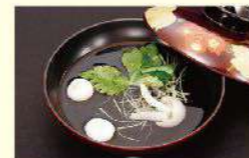
「吸い物」から「肝吸い」に変更 〈プラス)税込187円