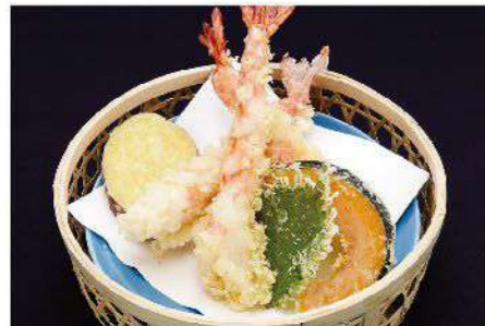
大海老天婦羅盛合せ 1,500円(税込1,650円)