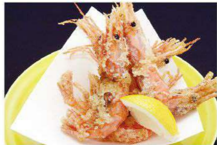
甘海老唐揚げ 600円(税込660円)