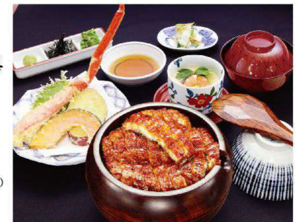
◆う家ひつまぶし ◆天婦羅盛合せ(かに・野菜三種) ◆茶碗蒸し ◆香の物 ◆吸い物(全5品) 5,300円(税込5,830円)