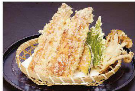
うなぎ天婦羅 1,900円(税込2,090円)