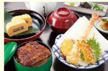
お子様ひつまぶし御膳 ◆う巻◆天婦羅盛合せ◆ミニひつまぶし ◆香の物◆吸い物(全5品) 2,200円(税込2,420円)