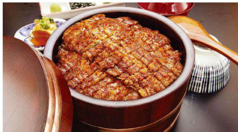
特上ひつまぶし (うなぎ1.5匹 ご飯450g)