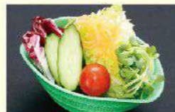
「ミニサラダ」付き 〈プラス)税込385円