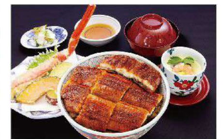
◆お通し◆天婦羅盛合せ◆サラダ ◆ご飯◆香の物◆吸い物(全6品) 2,300円(税込2,530円)