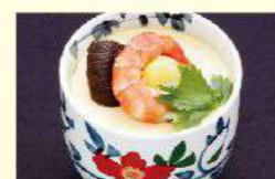
「茶碗蒸し」付き 〈プラス)税込440円