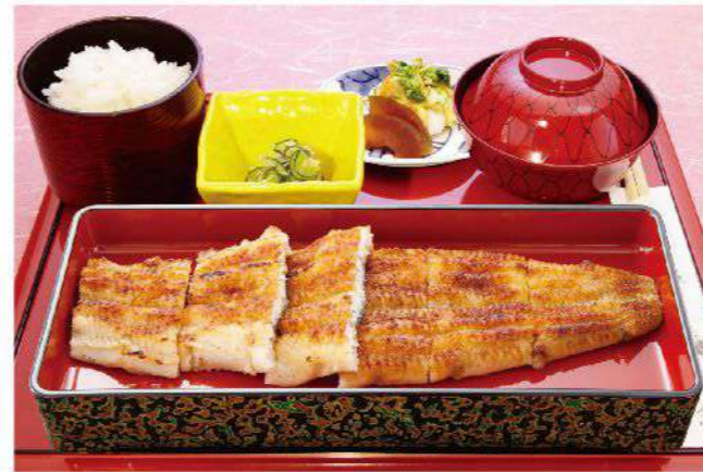
白焼き御膳(1匹) ◆お通し◆ご飯◆吸い物◆香の物付き 4,200円(税込4,620円)