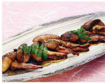
肝焼き 1,300円(税込1,430円) 数量限定