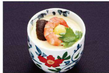
茶碗蒸し 500円(税込550円)