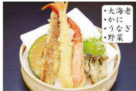
味くらべ天婦羅盛合せ 2,500円(税込2,750円)