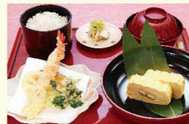
お子様御膳 ◆う巻◆天婦羅盛合せ ◆ご飯◆香の物◆吸い物(全5品) 1,500円(税込1,650円)