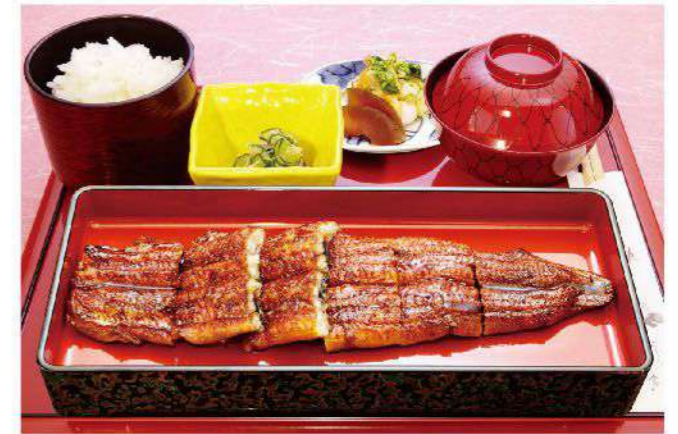
長焼き御膳(1匹) ◆お通し◆ご飯◆吸い物◆香の物付き 4,200円(税込4,620円)